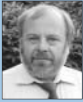
Thomas Wolf Nordstr. 33 51379 Leverkusen