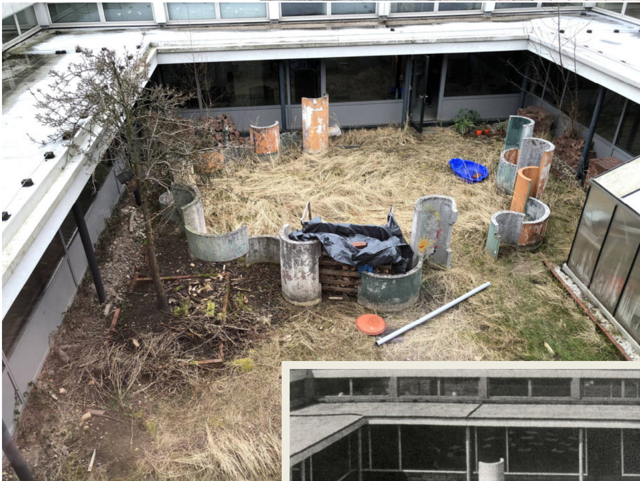
Innenhof Pestalozzischule Leverkusen . 23.03.2018