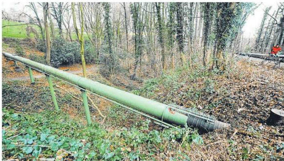
An der oberen Kirchstraße ist die seit über 50 Jahren existierende Hochdruck-Gasleitung, 70 Zentimeter dick, kurz zu sehen.